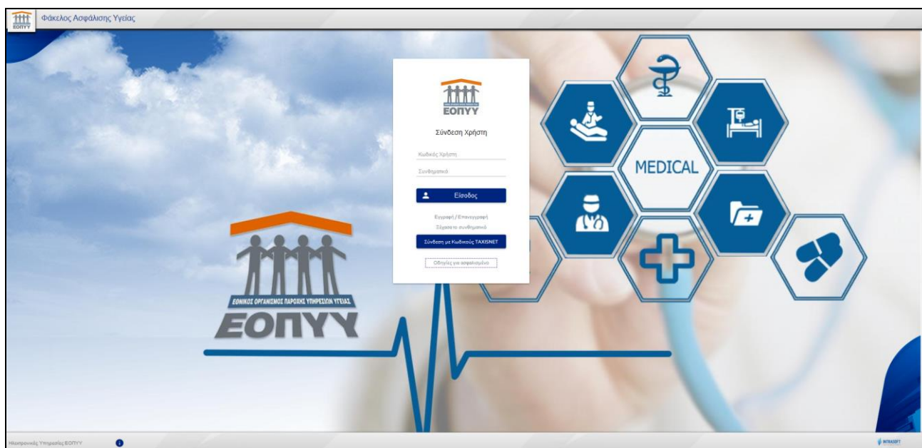
Είσοδος στα προσωπικά στοιχεία του Φάκελου Ασφάλισης Υγείας

Διαχείριση Φάκελου: Με την ολοκλήρωση της Εγγραφής ο πολίτης αποκτά δυνατότητα διαχείρισης του Φακέλου του από τον σύνδεσμο https://eservices.eopyy.gov.gr/eHealthInsuranceRecordInsPerson (Εμφάνιση ατομικών δεδομένων υγείας).